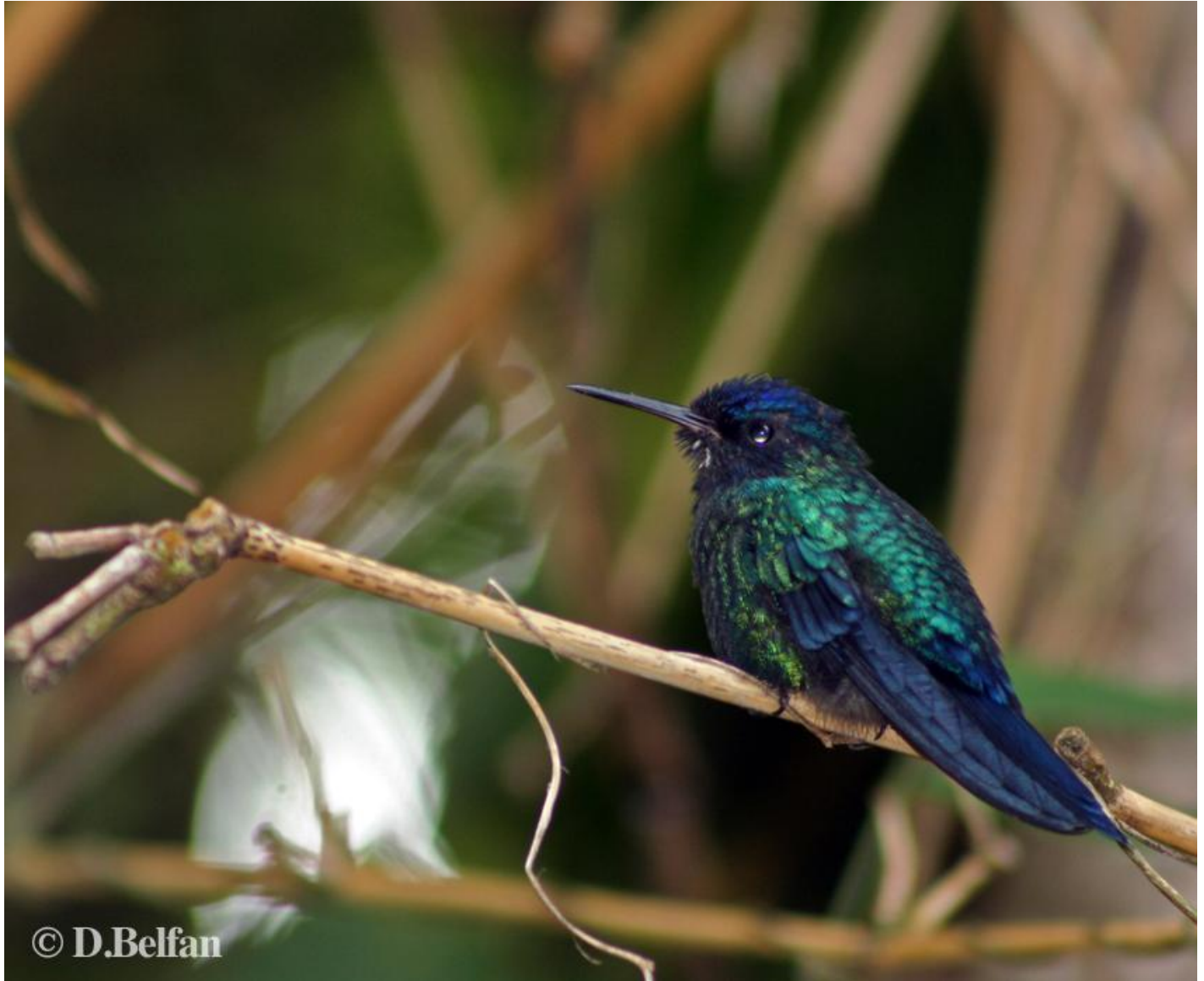
Colibri à tête bleue