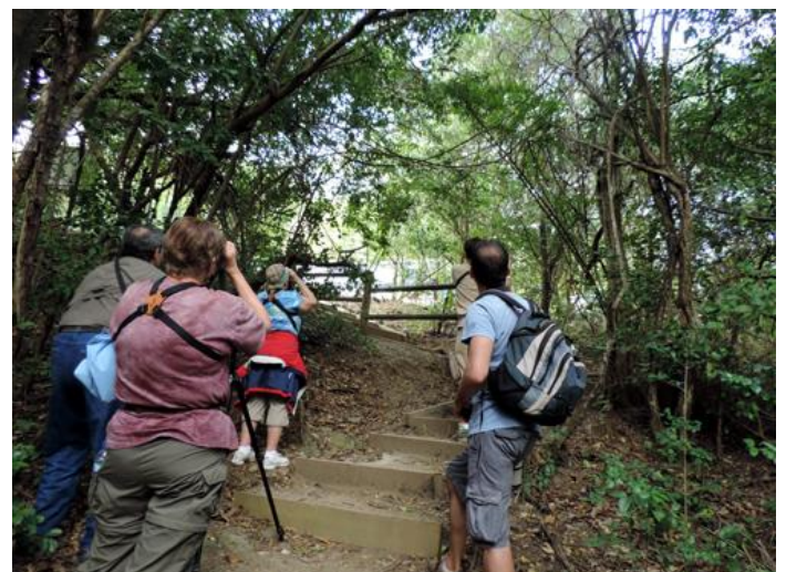
Réserve Naturelle de la Caravelle